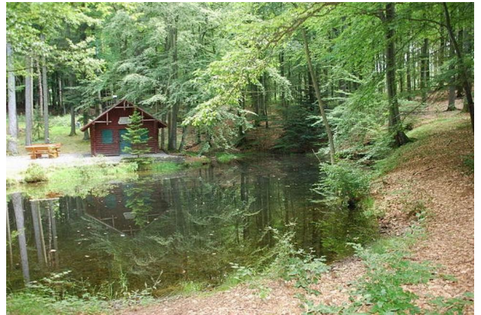
Waldhütte am Klingelfloss Autor Marlene Bollig Quelle Hunsrück-Touristik GmbH