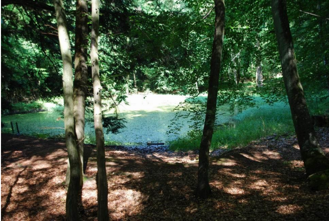
Weiber im Wald Autor Marlene Bollig Quelle Hunsrück-Touristik GmbH