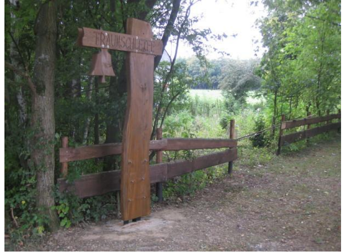
Eingangsportal Klingelfloss Autor Marlene Bollig Quelle Hunsrück-Touristik GmbH